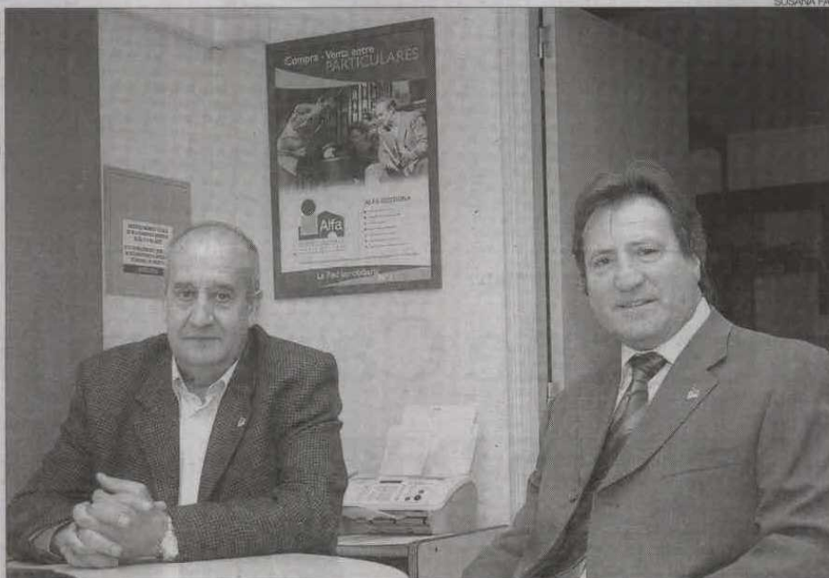
Destacados miembros del equipo de Alfa Inmobiliaria en la provincia de Castellón.

entre particulares es una de las iniciativas que la firma ha puesto en marcha con el objetivo de combatir la crisis que vive el sector. Recientemente, Alfa Inmobiliaria ha lanzado un buscador de oportunidades en su web, ha potenciado el alquiler de viviendas y ha desarrollado su expansión internacional con aperturas en diferentes mercados.